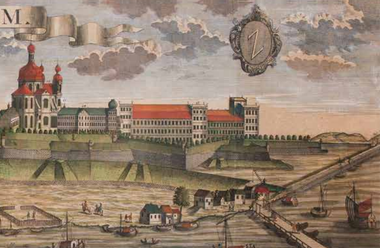
Stich, um 1755, Ankauf durch den Freundeskreis