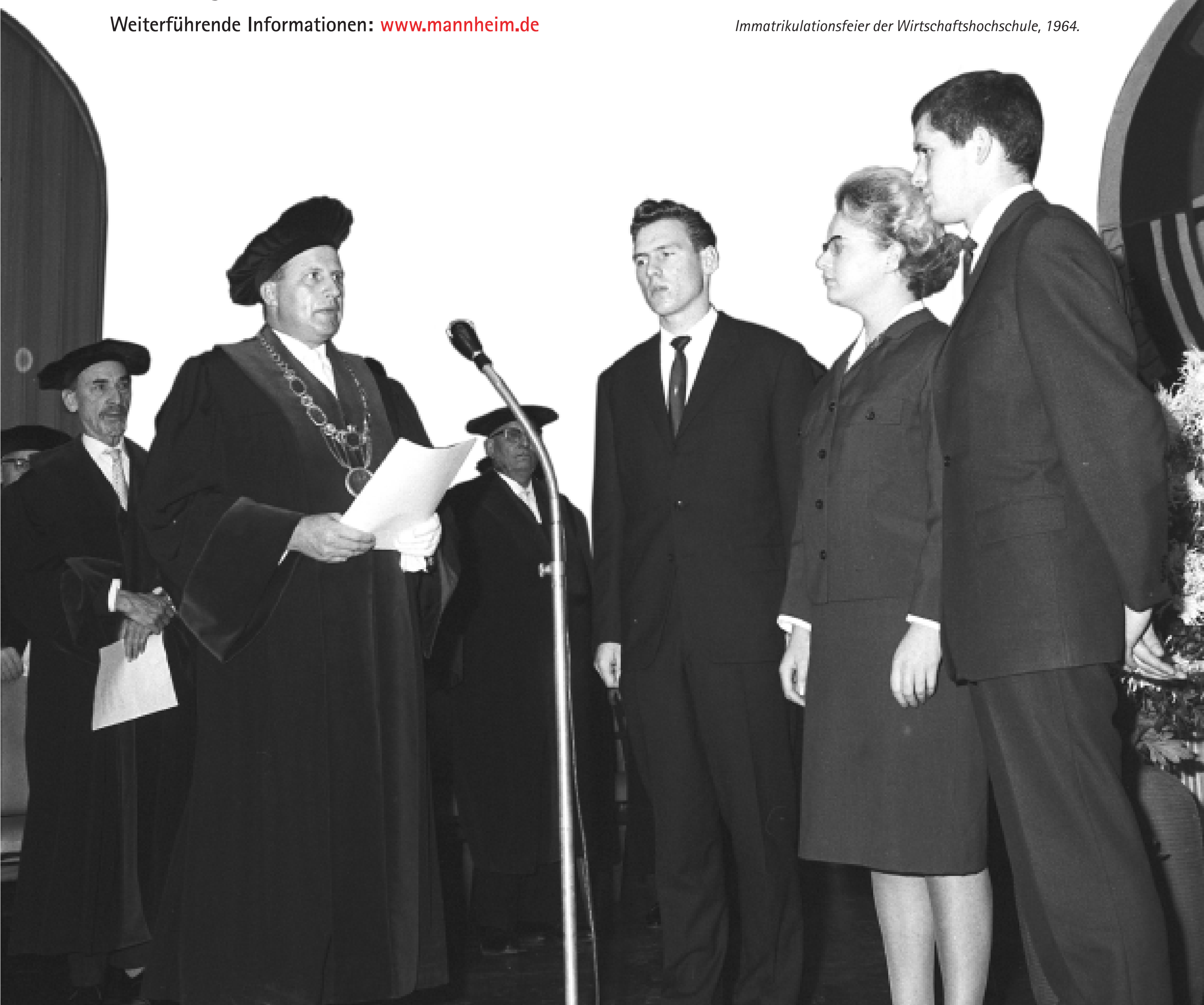
Immatrikulationsfeier der Wirtschaftshochschule, 1964.

Weiterführende Informationen: www.mannheim.de