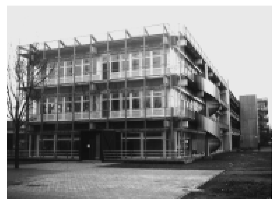
Der zusätzliche Raumbedarf der Universität wird mit Hilfe von Neubelegungen bzw. -bauten in den A- und L-Quadraten befriedigt. So wird beispielsweise in A 5 1972 ein Neubau für die sozialwissenschaftliche Fakultät errichtet, der 1998–2000 nochmals umgebaut wird.