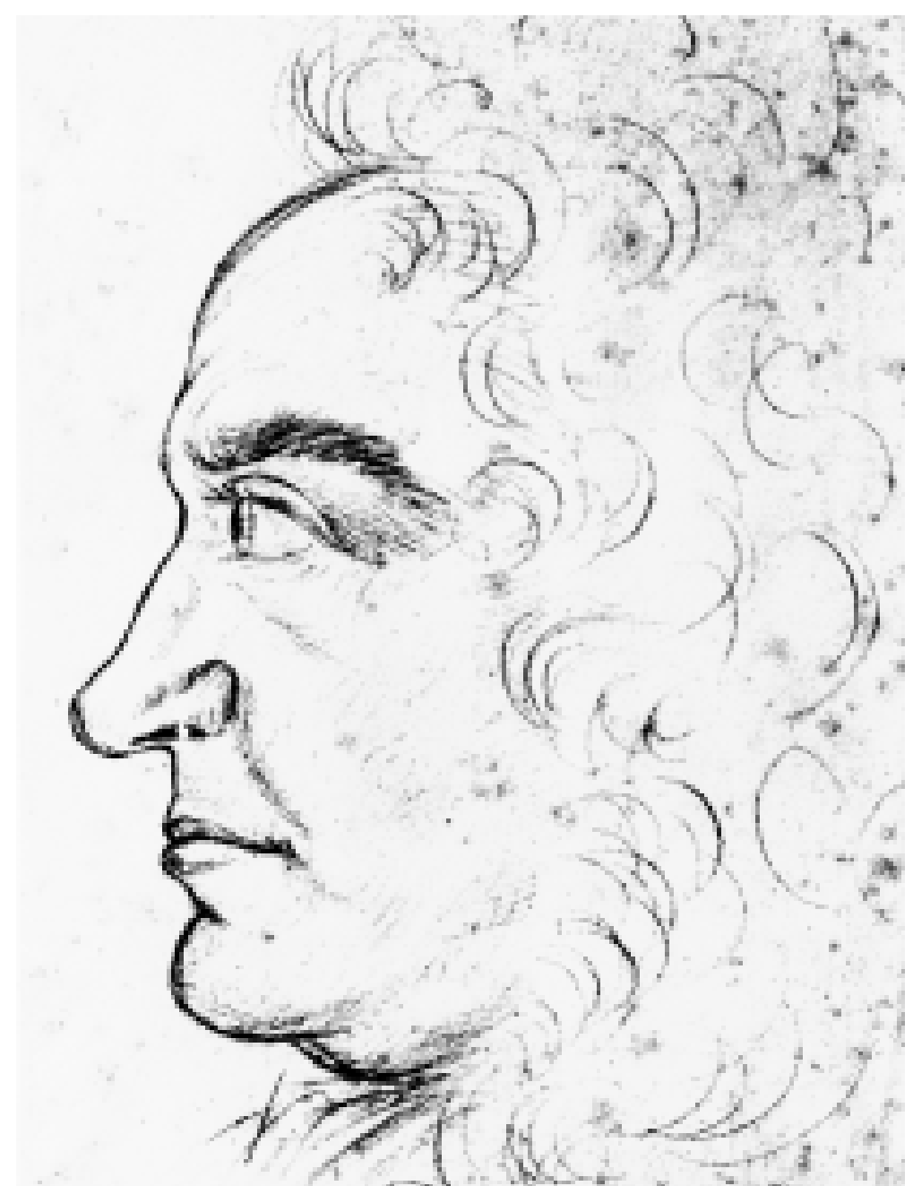
Selbstbildnis des niederländischen Bildhauers Gabriel Grupello, des Schöpfers der Pyramide.