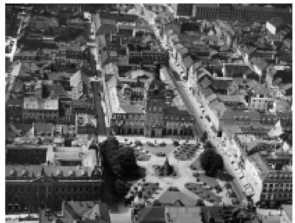
Schrägluftbild mit Paradeplatz, Kaufhaus, Postamt, Quadraten und Schloss im Hintergrund, frühes 20. Jahrhundert.

Am 27. Mai 1815 findet eine Parade bayerischer Truppen anlässlich des Geburtstags des bayerischen Königs Maximilian I. Joseph (1756–1825) statt. Er war von 1799 bis 1802/03 auch der letzte Kurfürst von der Pfalz.