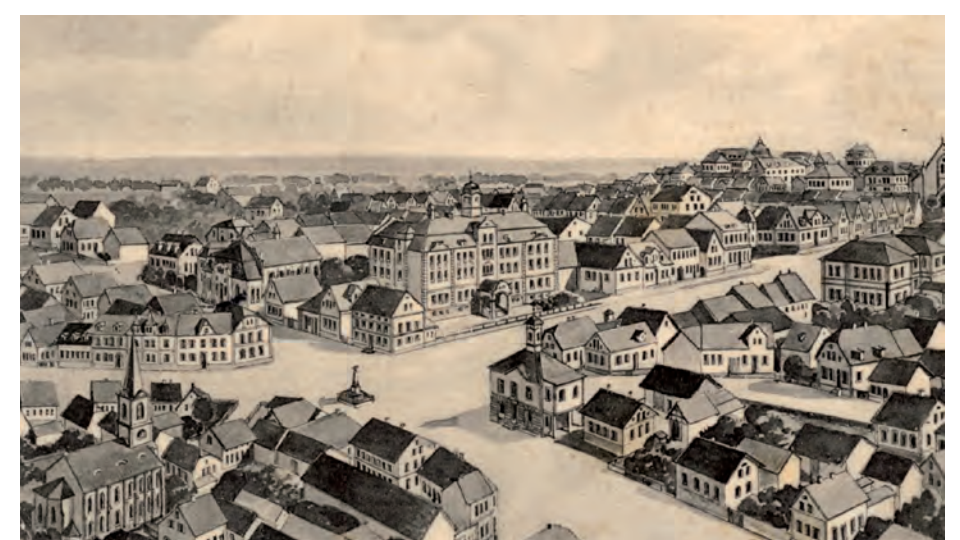
Der alte Ortskern von Sandhofen, der sich zwischen der evangelischen Dreifaltigkeitskirche (links) und der erst 1896 errichteten katholischen Bartholomäuskirche (rechts) erstreckt, um 1915. Gut zu erkennen sind das 1810 erbaute Rathaus und der imposierende Bau der Friedrichschule (heute: Gustav-Wiederkehr-Schule) von 1909.

Weiterführende Informationen: www.mannheim.de