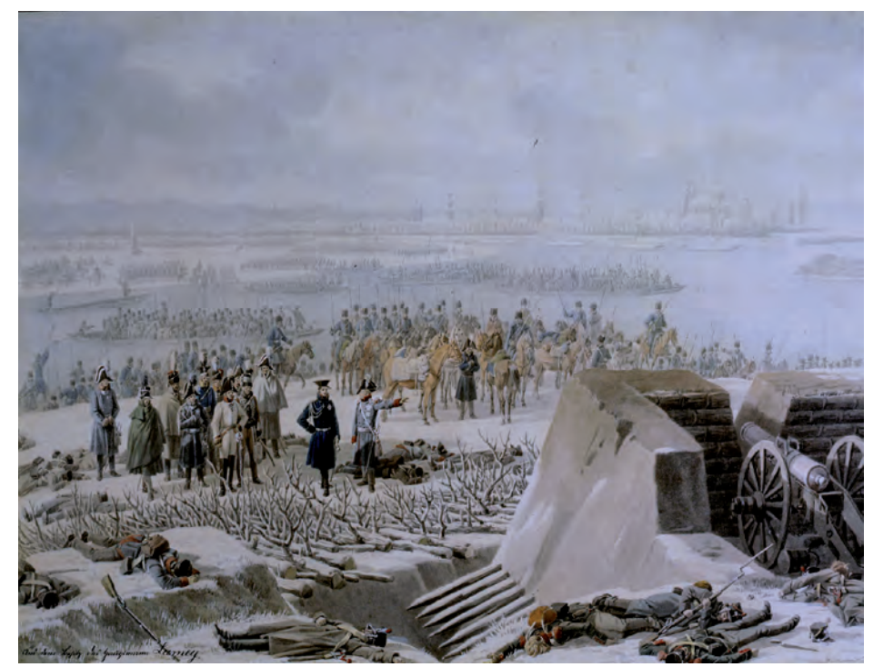
Als sich Napoleons Kriegsglück wendet, spitzt sich auch die Lage in Sandhofen zu. Nach dem erfolgreichen Rheinübergang an der Jahreswende 1813/14 – hier dargestellt in einem zeitgenössischen Aquarell von Wilhelm Kobell – schlagen die alliierten Truppen Preußens, Österreichs und Russlands die napoleonische Armee in die Flucht. Über Wochen hinweg bestimmen Einquartierungen den Alltag im Dorf bis der Krieg weiter zieht.