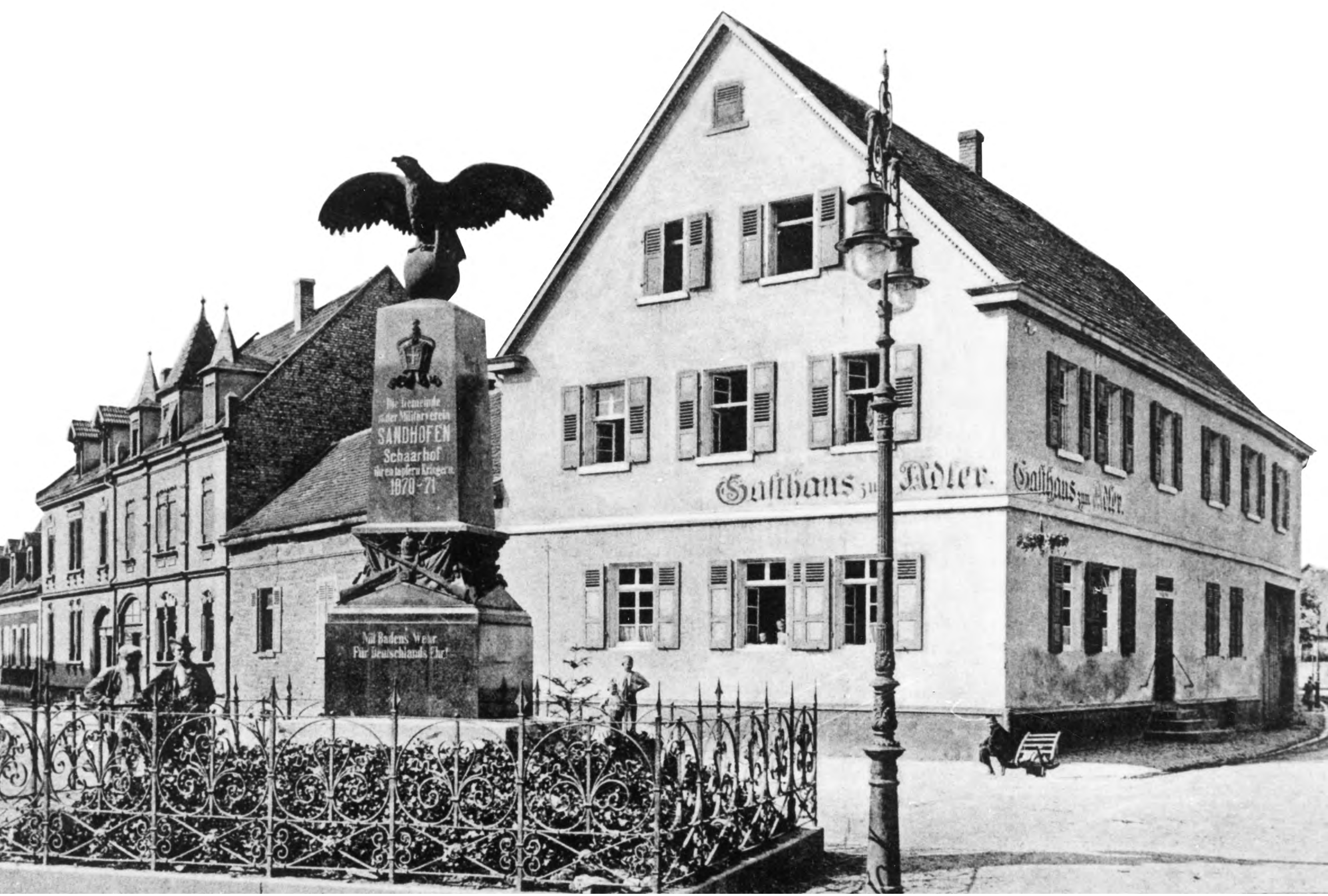
Das Wirtshaus zum Adler, hier auf einer Postkarte um 1900, erhält bereits 1716 die so genannte Schildgerechtigkeit, also das Recht auf Bier- und Weinausschank.