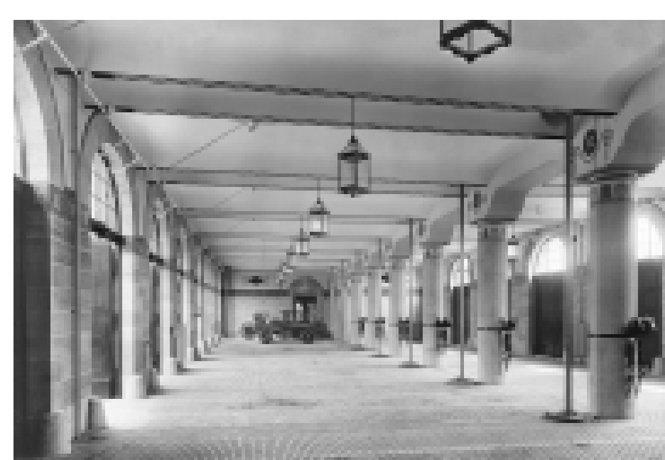
Die Wagenhalle im Erdgeschoss der Feuerwache, 1912. Nach Kriegszerstörung und Wiederaufbau droht dem repräsentativen, heute denkmalgeschützten Bau in den 1970er Jahren im Rahmen der Planungen zur Neckaruferbebauung Nord der Abriss. Dagegen formiert sich eine Bürgerinitiative, die den Abbruch, unterstützt von der Landesdenkmalpflege, zu verhindern weiß. 1979-81 erfolgt der Umbau zum Kulturzentrum mit Veranstaltungshalle, Galerie, Künstlerateliers sowie dem Kinder- und Jugendtheater Schnawwl.