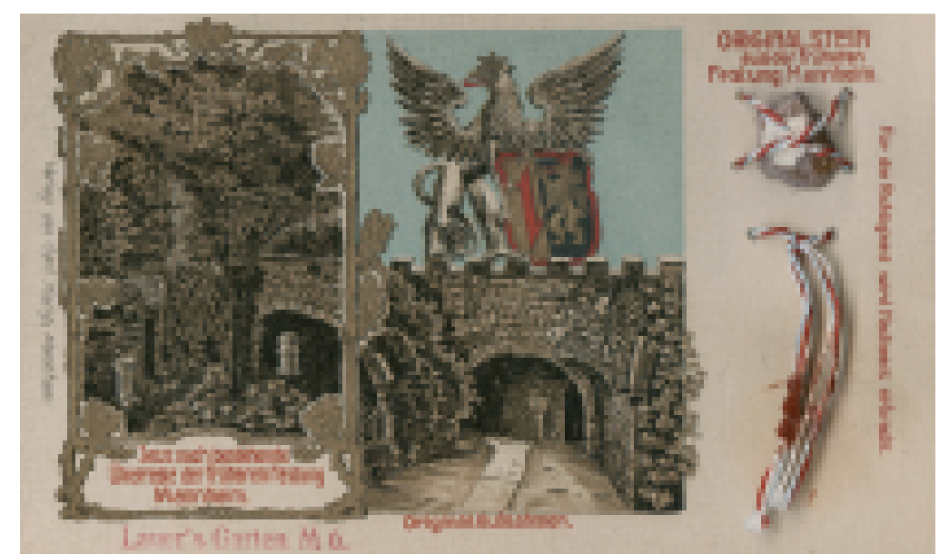
Um 1900 werden Postkarten mit Originalsteinen der alten Mannheimer Festung verkauft.